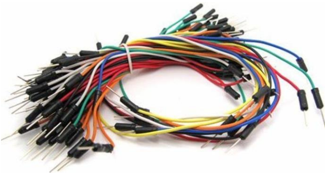
Figura 1: fios jumper MM.